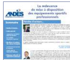
Etude « La redevance de mise à disposition des équipements sportifs professionnels » Fév. 2014