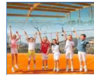
Guide « Equipements de tennis » Oct. 2014