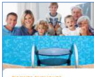
Guide « Piscines Publiques » Juin 2012