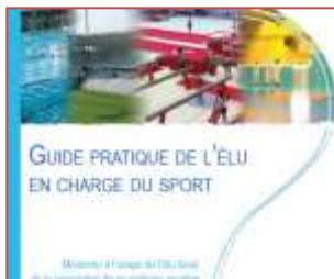
Guide pratique de l'Élu en charge du Sport Juin 2014